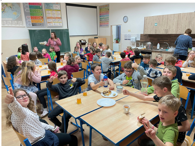
Noc ve škole si všichni moc užili!