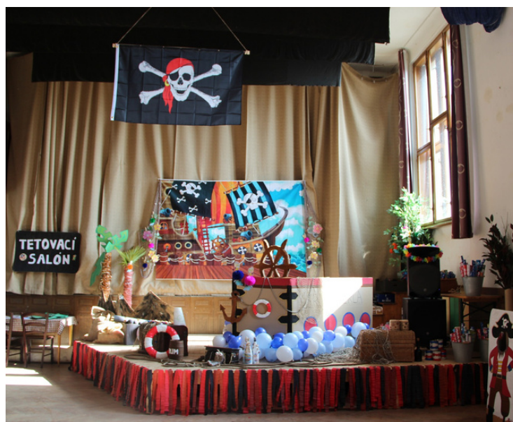
Pirátská loď jasně vévodila všem pirátským kulisám.