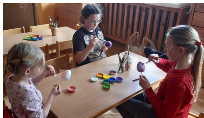
Barvení velikonočních vajíček.