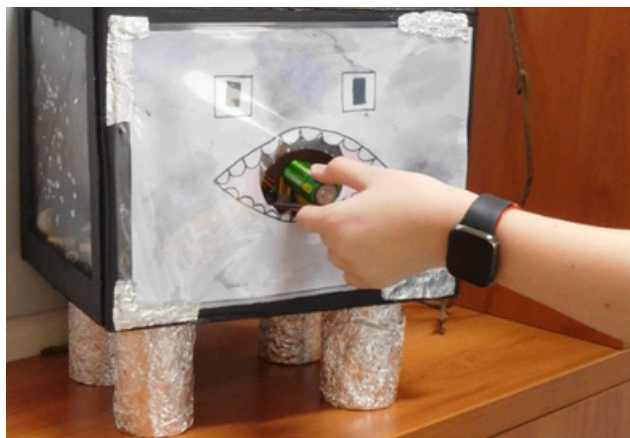
Baterkožrout často mění tvář.