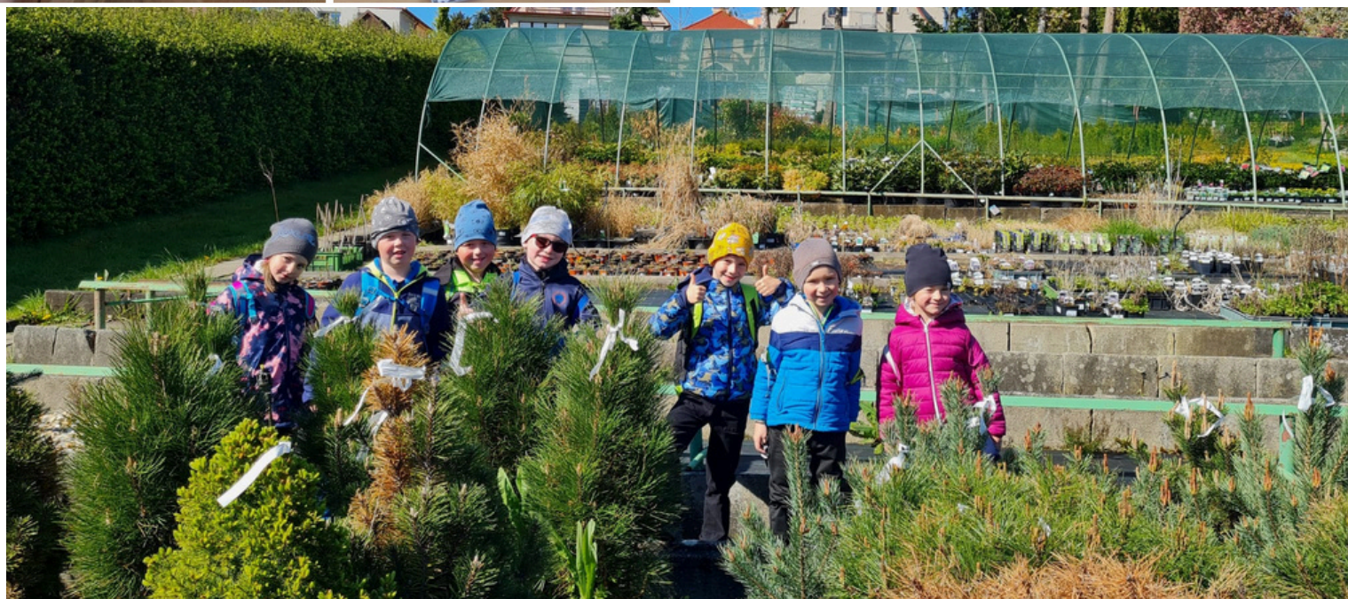
Předškoláci si zkracují čekání na plavecký kurz poznáváním květin v tábořském zahradnictví.