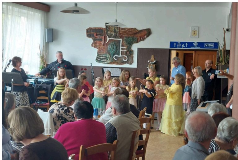
Setkání seniorů zpestřily děti.

Setkání seniorů Miličína se vydařilo a největším přáním všech je zase se za rok ve zdraví sejít.