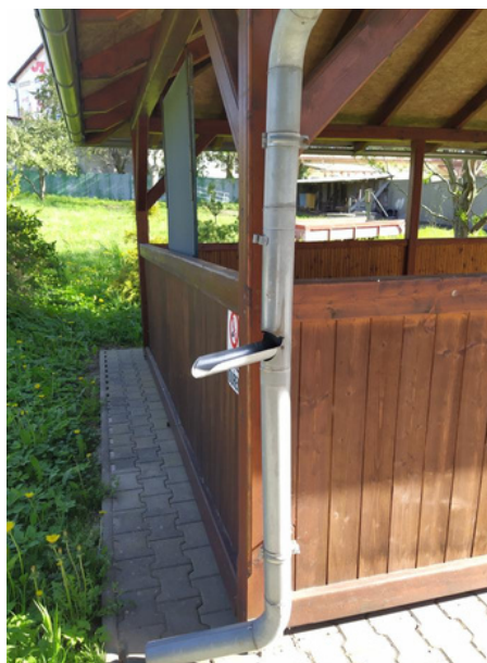
Těšíme se na sud .