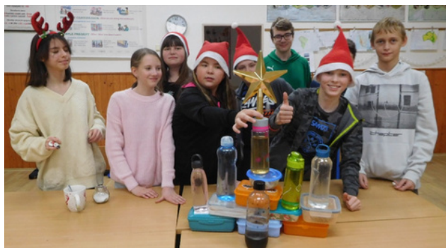
Našeho Baterkožrouta pořád krmíme.

Kviz o plastových obalech byl součástí vánoční besídky.