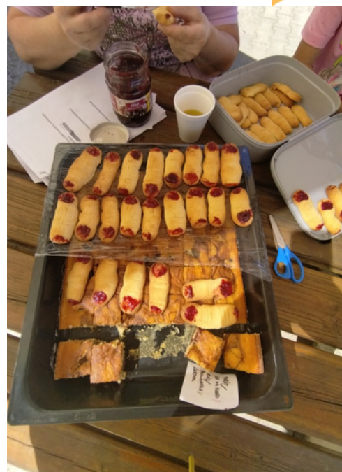
Tereza Klosová

Na děti čekaly různé čarodějnické disciplíny - let na koštěti, hod pařátem, poznávání čarodějnických předmětů v kouzelném vaku, čarodějnický kvíz a vaření čarodějnického lektvaru (žabí hlen). Po splnění všech disciplín dostaly děti sladkou odměnu, odvážlivci mohli ochutnat prsty (linecké těsto). Celé odpoledne nás provázelo krásné slunečné počasí, i když nám trochu foukal vítr, ale to vůbec nevadilo, protože nám vítr lépe popoháněl košťata.