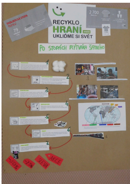
Zmapovali jsme zrod bavlněného trička.