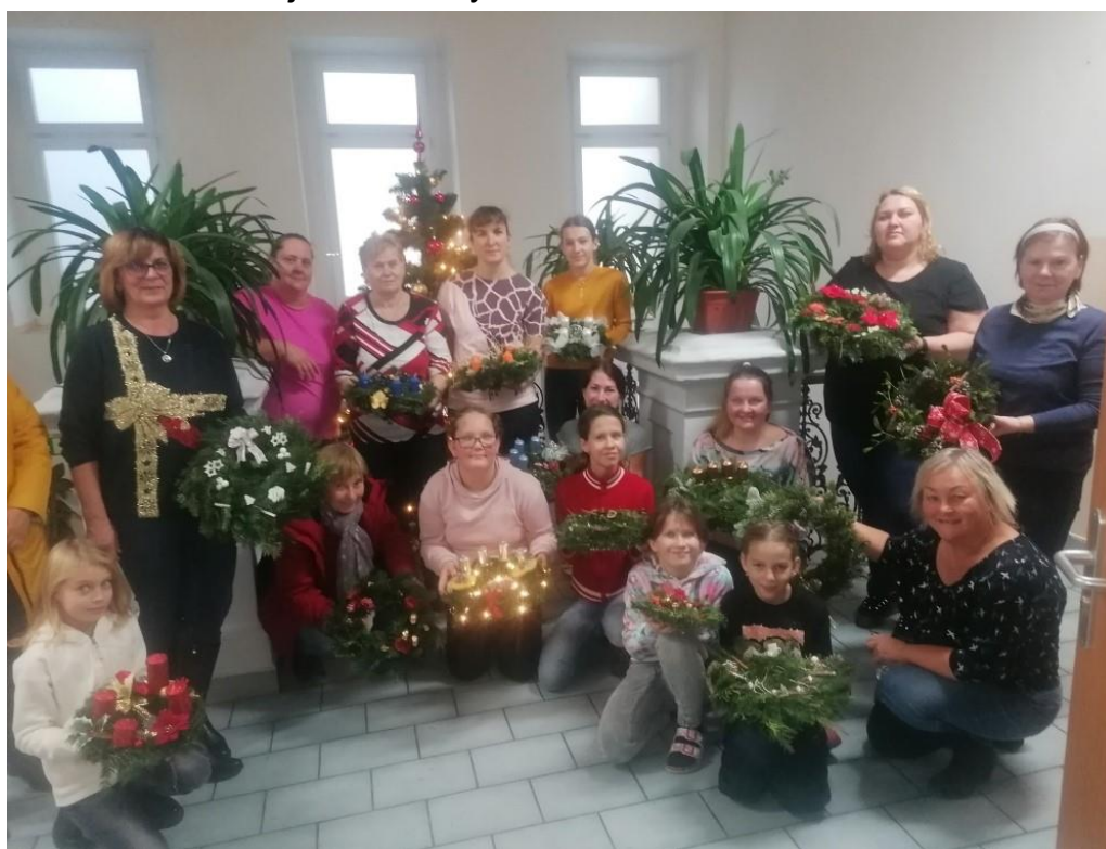
Text a foto: J. Novotná