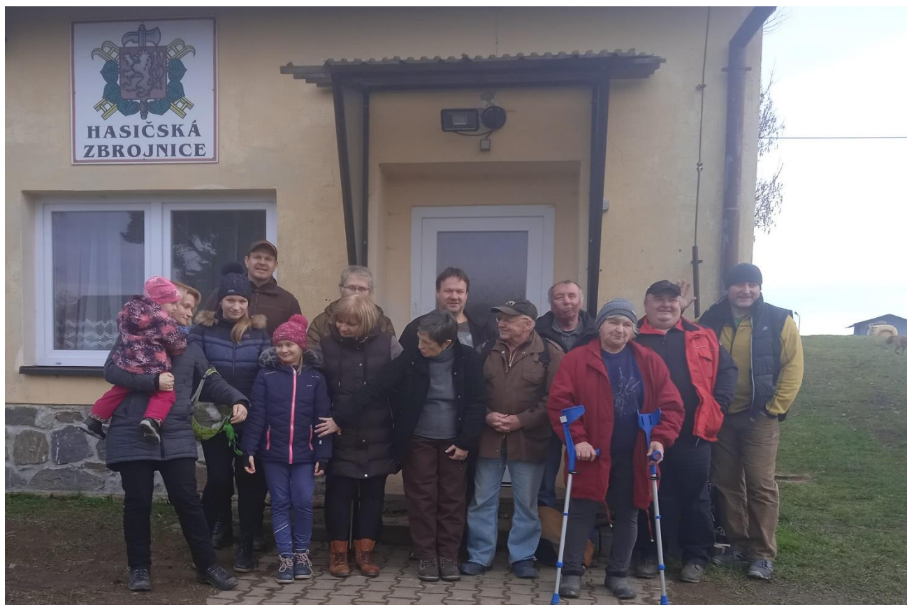
Text a foto: -td-