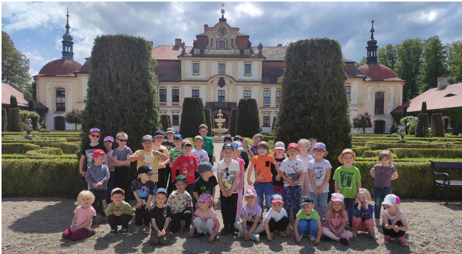
Společné foto před vstupem do zámku.