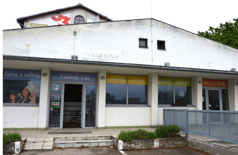
Vnitřní prostory obchodu jsou po nedávné rekonstrukci a plně vybavené.

Jména adresátů se nesdělují, jenom se vybírá žena/muž. Až pošta dopis doručí, tak vše ostatní zařídí personál – přidělí dopis, pomůže ho přečíst apod.