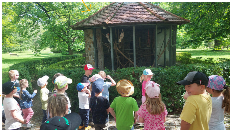
Kolektiv MŠ Miličín

Na výletě nám přálo krásné počasí, a tak si děti mohly za krásného slunečného dne projít a prohlédnout zámeckou zahradu. Zde pozorují ukřičené papoušky.