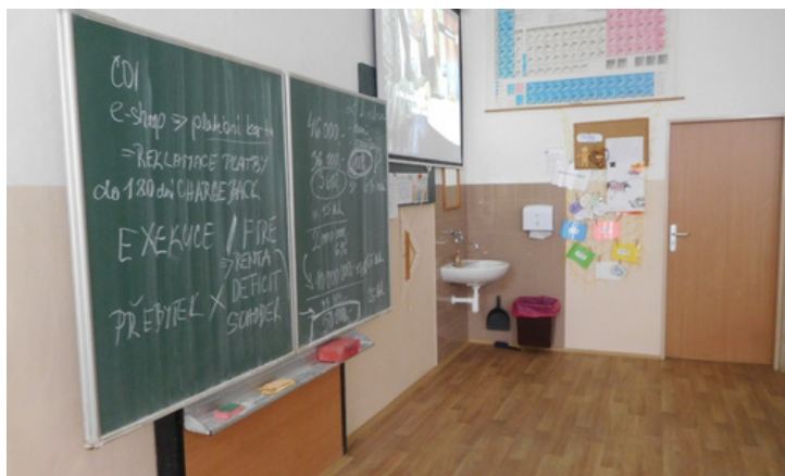
Odborných pojmů byla plná tabule.

Prekvapilo mě, kolik našich dětí má vlastní účet s kartou, a na druhou stranu kolik ještě nedostává kapesné a nehospodaří s ním. Naším společným přáním je, aby se mladí lidé vyznali v různých finančních produktech a službách, aby věděli, kde získají důvěryhodné informace, a aby nenaletěli na lákovou reklamu.