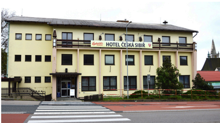
Budovu Hotelu Česká Sibiř vlastní Město Miličín. Využití ji plánuje pro potřeby základní školy a místních obyvatel.

V České republice proběhl v květnu 2. ročník akce Psaní od srdce organizovaný Diakonií Českobratrské církve evangelické. Smyslem je udělat radost někomu z domova důchodcům nebo podobného zařízení, kdo je sám, nikam nechodí, nemá kontakty se světem za zdi budovy. Zájemci o ruční napsání dopisu se po internetu zaregistrují v nabízených zařízeních a obdrží adresu a stručné pokyny k obsahu.