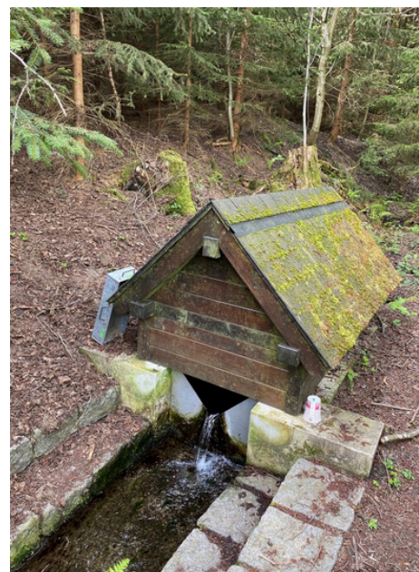
Pramen Bílá studánka