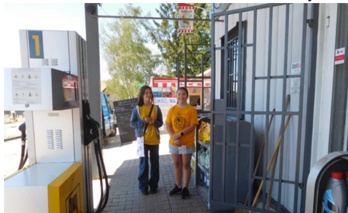
Nejlepší stanoviště je u čerpací stanice.