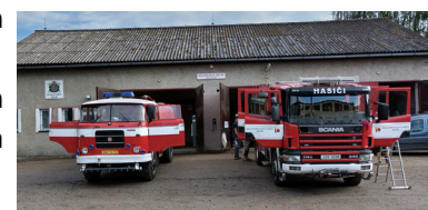
Člen JSDH Miličín