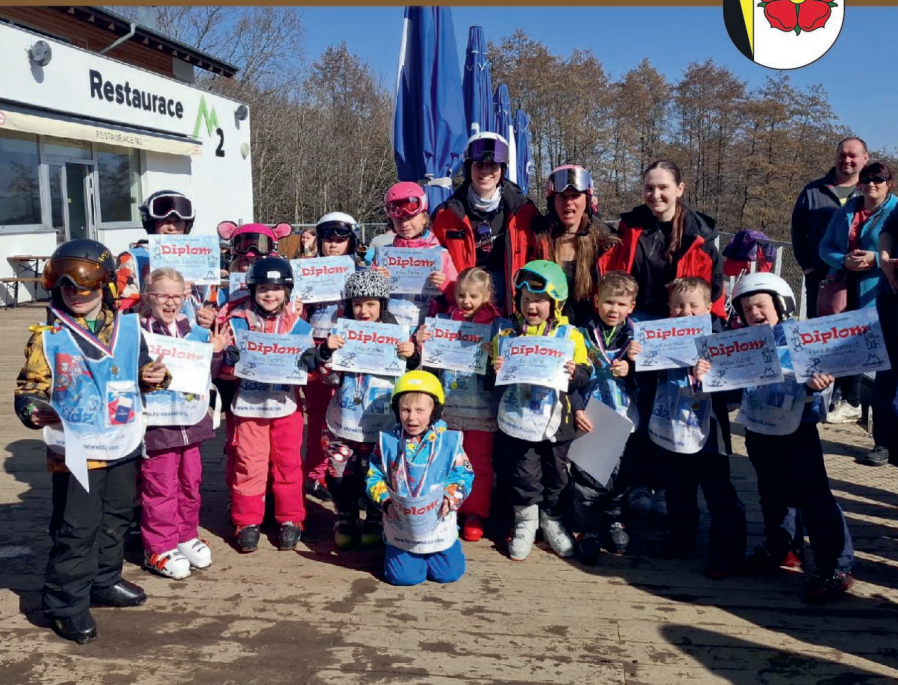
Předškoláci na lyžařském kurzu na Monínci